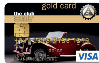
ACS VISA Card Gold

1) Limite di spesa: il limite indicato rappresenta il limite di spesa valido per entrambe le carte nel loro complesso (limite globale).