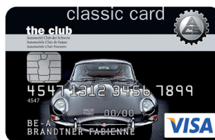
ACS VISA Card Classic

Carta per il partner inclusa nel prezzo di affiliazione all'ACS inclusa nel prezzo di affiliazione all'ACS 3)